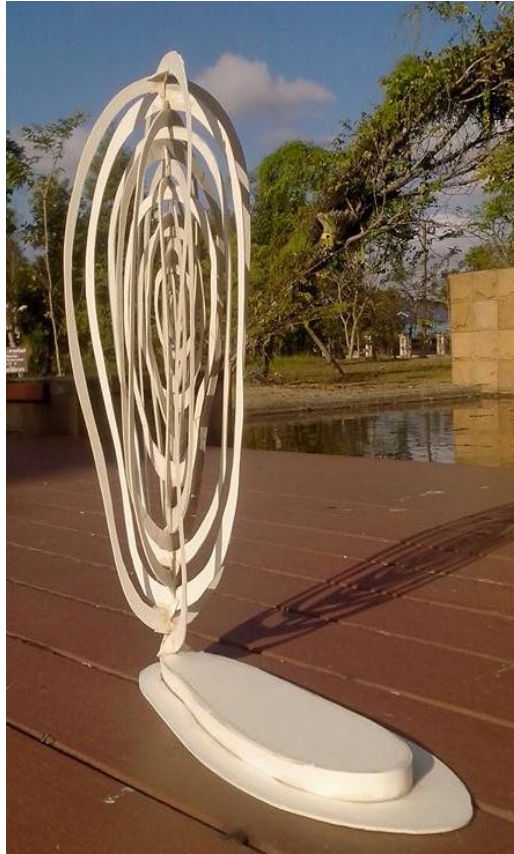
ภาพประกอบที่ 2 การออกแบบร่าง 3 มิติ

ทำจากกระดาษชานอ้อยเนื่องจากมีลักษณะเป็นแผ่นตัดได้ง่ายและใกล้เคียงกับวัสดุเหล็กแผ่นที่ใช้ทำผลงานจริง