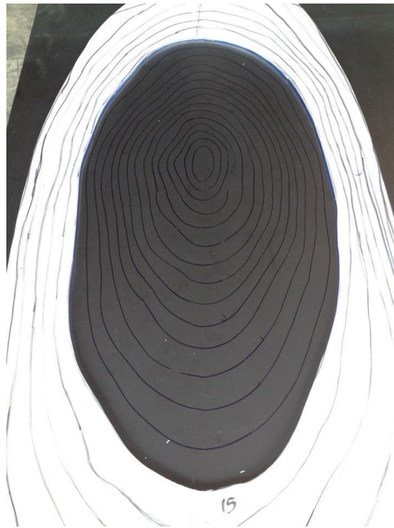
ภาพประกอบที่ 4 ขั้นตอนการทำงาน

นำแบบร่างที่ขยายไปวางทาบบนแผ่นเหล็กแล้วตัดตามแบบด้วยเครื่องตัด Plasma