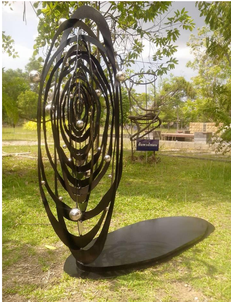
ภาพประกอบที่ 6 ผลงานที่เสร็จสมบูรณ์

“สัญลักษณ์แห่งกาลเวลา” เนื่องในโอกาสครบ 20 ปี ม.หาดใหญ่ "Sign of Time" for 20 th Hatyai University Anniversary 60 X 120 X 120cm., 2016 เชื่อมโลหะ, สเตนเลส Welding, Stainless