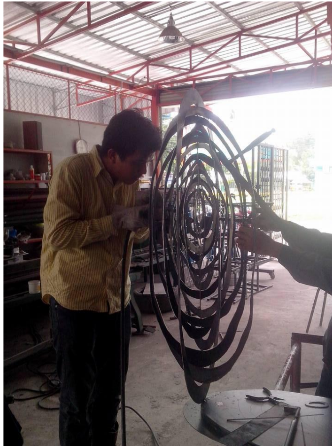
ภาพประกอบที่ 5 ขั้นตอนการประกอบชิ้นงาน

นำวงรีที่ตัดตามแบบมาประกอบด้วยเครื่องเหล็กเชื่อมทีละวงโดยเริ่มจากวงนอกสุดเพื่อกำหนดความสมดุลของผลงาน